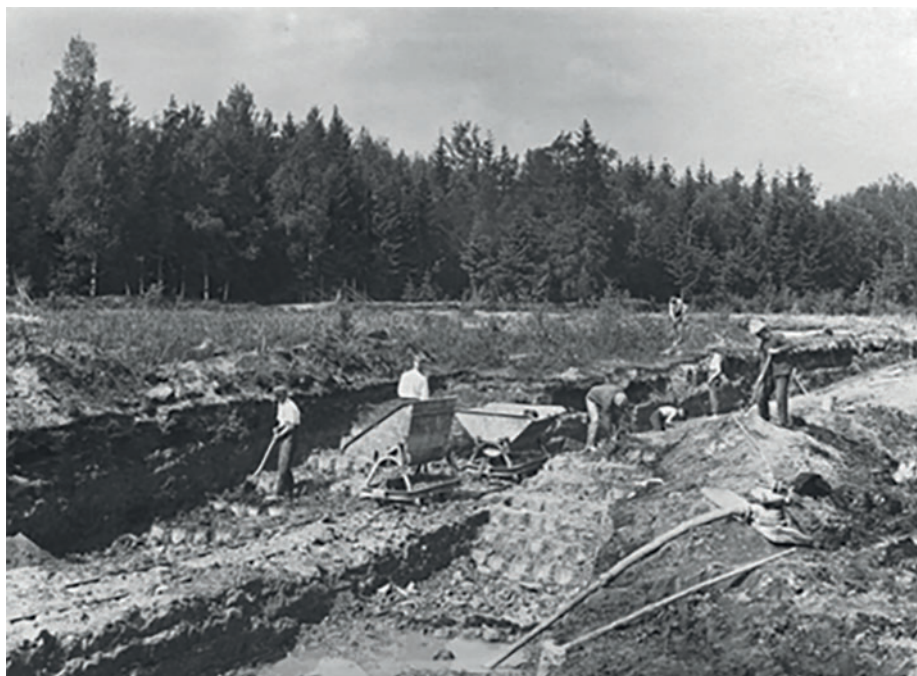
Jn 14. Savi kaevandamine käsitsi. 1940.–1950. aastad.

Kohalike inimeste mälestuste järgi olevat mehhaniseeritud ja ulatuslik savitoorme kaevandamine viinud alla toodangu kvaliteedi, kuna korraliku vormisavi hulka sattus sel viisil ka palju ebakvaliteetset (Padosepp 2011: 7). 1958. aasta kevadel hakati ka savi kaevandama ja laadima ekskavaatori jõul, jõudluse tõstmiseks ühendati savikarjäärid. Kasutusele võeti ka sajakilovatine elektrijaam (Pistrik 1958).