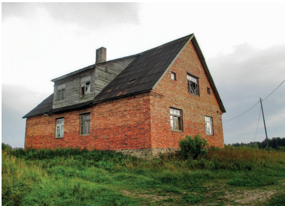
Jn 16. Tellisetehase tööliste elumaja, mis valmis 1958. aastal. 2012.

Tehases töötas nii kohalikke külaelanikke kui ka lähiümbruskonna rahvast. Tööle käidi ka Vene NFSVst (Padosepp 2011: 14), peamiselt Pihkva oblastist. Seoses sovetiseerimisega kasvas Eestis eriti 1940.–1950. aastatel mitte-eestlaste arv (Võrumaal moodustas see sel perioodil 9,6% rahvastikust) ja arvatavasti asus neid ka piirialal paiknevasse tellisevabrikusse. Kriiva asunduses elas 1959. aastal 114 inimest, Kriiva külas oli elanikke aga 24 (Katus, Puur, Põldma 2003: 78). 1962. aastal elas Kriiva asunduses 69 ja Kriiva külas 30 elanikku, kellest venelasi oli vastavalt 43 ja 16 (Kriiva külas ka kolm lätlast). Eraldi on toodud välja Luha telliskivitehase elanike arv, mis oli eelnimetatud aastal 40 ja millest enamiku moodustasid mitte-eestlased – 30 venelast ja kaks lätlast.