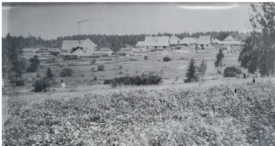
Jn 7. Vaade Telliskivi talule ja tööstusele 1934. aasta suvel. ERA.4460.1.1966. l. 14.

Nii asendati Vungi tööstuses 1935. aastaks aurumasin tuleohutuse seisukohalt turvalisema petroolimootoriga, lokomobiiliruumi aga seati üles glasuuri valmistamiseks tinaveski (ERA.842.1.4135).