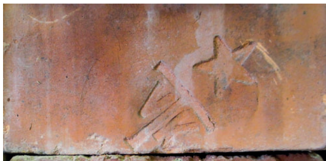
Jn 12. Vastseliina Tööstuskombinaadi (VTK) Luha tellisetehase templiga märgistatud kivi.

1950. aastate keskpaigaks oli olukord ilmselt paranenud, kuna kohalikus ajalehes märgiti, et Luha tellisetehas on lühikese ajaga muutunud kohaliku tööstuse tähtsamaks sõlmeks (Pilt 1955). Tehas töötas kevadest kuni sügiseni kolmes vahetuses, talvel telliseid ei toodetud, töötas ainult nn potitare, mille keldrisse varuti talveks vajaminev savi. Talvel tegeldi kütte varumisega, töötati ka tehase juurde ehitatud saeveskis (Padosepp 2011: 16). Võimalik, et tegemist oli kunagise Vungi saeveskiga, sest kohalike valimiste aegu kuulusid Luha