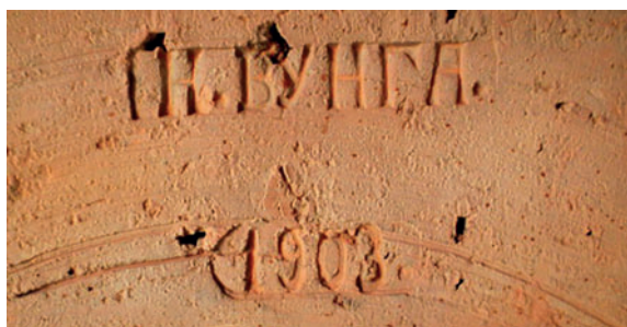
Jn 5. Nikolai Vungi tööstuse telliskivi. 1903.