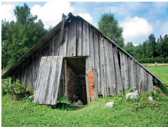
Jn 21. Koidu talu kelder.