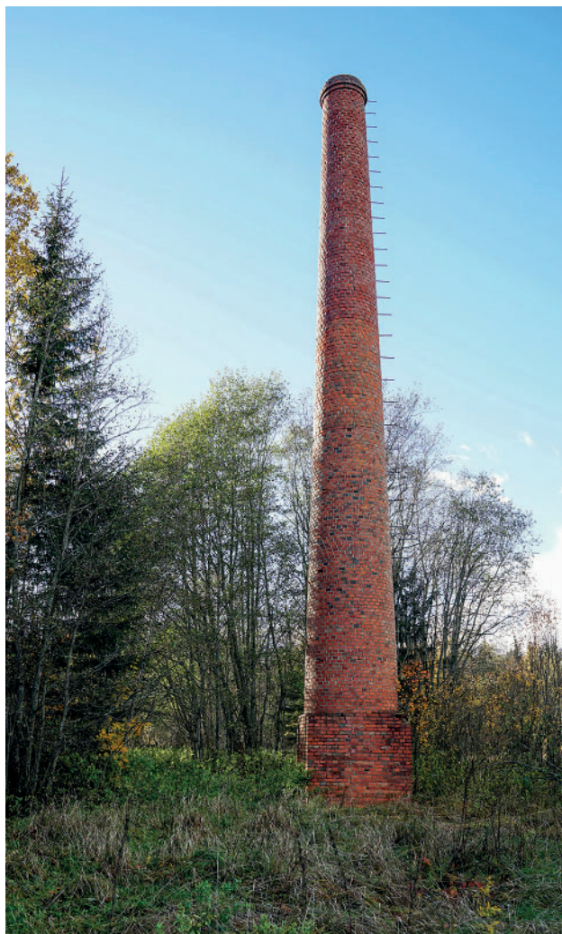
Jn 9. Savitööstuse korsten.