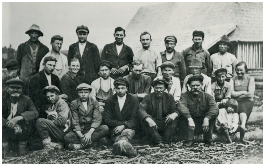
Jn 10. Vungi savi- ja metsatööstuse töölised. 1930. aastad.