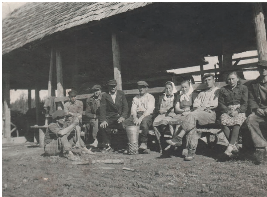
Jn 13. Luha tellisetehase töötajad. 1951. PTM F 171:4/F4-103.

tellisetehasega samasse valimisringkonda ka Võru metsatööstuskeskuse koresöödabaas Vungi (Naarits, Hiob 1957).