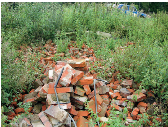
Jn 22. Tellised Koidu talu õuel. 2011.

poolt soovitud kahjutasu kroonidesse ümber arvatutult summas 2000 krooni. Isikliku mootorratta eest, mis oli rekvireeritud Eesti vabastamisega seoses , sai omanik taotletud 550 krooni asemel vaid 230 (samas, l. 9). Pole selge, kas tööstus tegutses ka sõja ajal, kuid tõenäoliselt jätkus tootmine veel 1950. aastate alguseni, kuna 1951. aastal on Eesti NSV Tööstusliku Kooperatsiooni süsteemi kuuluvate savitööstuste hulgas märgitud ka Misso valla Savimäe tööstus. Soka