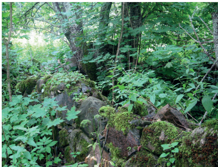
Jn 2. Kunagise Vungidele kuulunud talu varemed. 2010.

autotee ja maja vahel, kus inimekäs (labidas) oli sonkinud looduslikku murumätast ja tekkinud aukudesse külvanud lilleseemet.