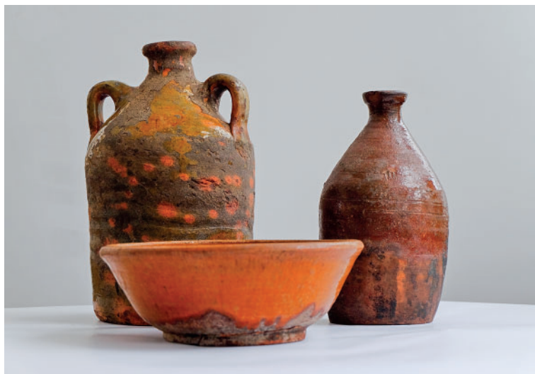
Jn 15. Luha tellisetehase savinõud. Erakogu. Foto: Heiki Pärdi.

1950. aastatel algasid kolhoosides ulatuslikud maaparandustööd ja kasvas vajadus maaparandustorude järele. 1958. aastal oli Luhal toodetud peamiselt Vastseliina rajooni vajaduste katteks 77 000 dreanažitoru. Kuigi Luhamaal toodetud savitorusid peeti kvaliteedilt paremaks kui Sangaste vabriku torusid, mis ei talunud suuri temperatuurikõikumisi ja pragunesid, esines ka Luha tehases praaktoodangut, kuna osa torusid olid kõverad, lapikud või ebatasaste otstega, mistõttu ei sobinud korralikuks ühendamiseks (Uus pealetung ... 1958).