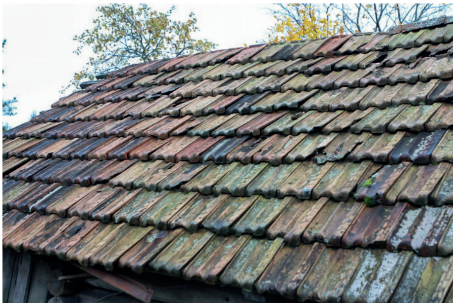
Jn 8. Vungi tööstuse katusekivid.